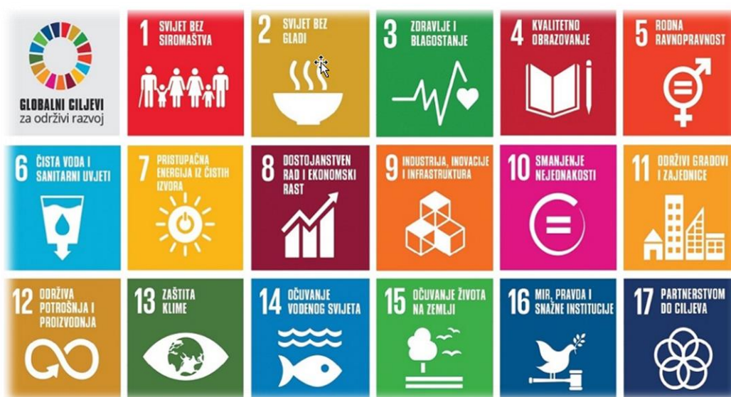
Slika 3. Ciljevi održivog razvoja